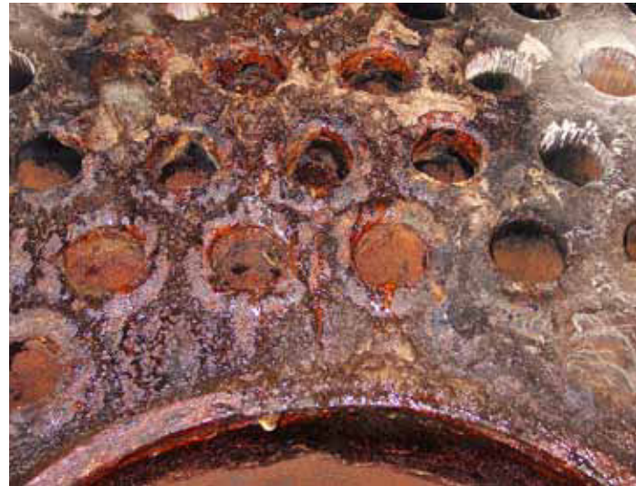
Kalkablagerungen, Korrosion, Erosion und Verschlammung führen zu Heizungsausfällen und teuren Reparaturen.

bodenheizungen wurden undicht. „Der Betreiber hatte, weil der pH-Wert in den sauren Bereich rutschte, mit Chemie nachgeholfen“, erklärt Gözl. Das sei keine dauerhafte Lösung, dafür müsse die Ursache gefunden werden. Deshalb sei nach der Herstellung der Wasserqualität eine Änderung im Betriebsverhalten unerlässlich, nur dann könne der Erfolg von Dauer sein. Momentan gibt es nur ein einziges HNRS, das im Raum Baden-Württemberg zum Einsatz kommt. „Bei einer Entfernung über 150 Kilometer überlegen wir mit dem Kunden, ob der Einsatz des HNRS wirtschaftlich Sinn macht“, so Gözl. Da das Auftragsbuch voll ist, denkt das Unternehmen daran, zukünftig etwa fünf mobile Anlagen in verschiedenen Größen selbst zu betreiben. Weitere HNRS sollen mit Franchising-Partnern in ganz Deutschland zum Einsatz kommen. ◀